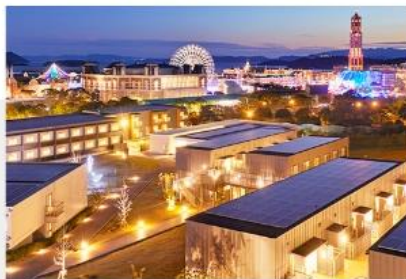
豪斯登堡機器人酒店

白天是美麗的花海，晚上則變身為世界最大燈節燈海，充 滿歐式的街道處處是拍照景點。