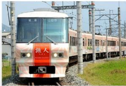
太宰府開運旅人列車

在寬闊、開放且綠意盎然的「眺望之丘」上，遊客可眺望九十九島的壯麗全景，體驗前所未有的美景。