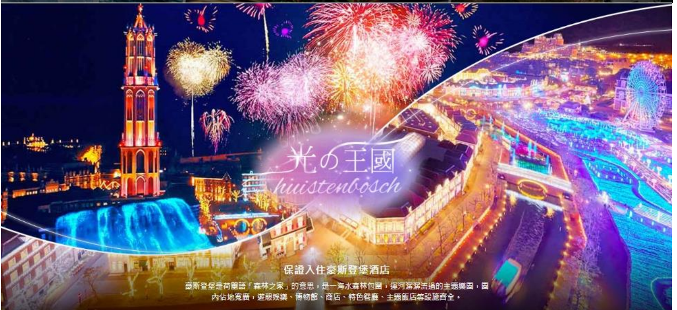
保證入住豪斯登堡酒店

園區內有多達約40種的遊樂設施，適合兒童和成人遊玩， 整年以各種活動吸引遊客不斷造訪，每一回都像是全新的體驗。