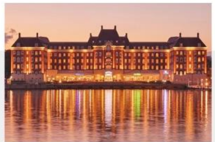
豪斯登堡海牙酒店

由多種建築組成，大廳充滿藝術氣息，連接各種建築的是一 條色彩繽紛的長廊，光是走著走著就讓人感到幸福。 (本行程表及所使用飯店，敝公司保留調整之權利。)