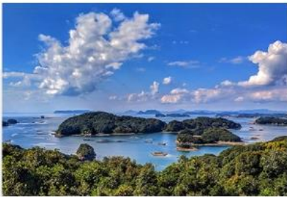
九十九島觀光公園

乘坐稱為「到恩烤」的小舟沿菅義城河順流而下，由河面上遊玩這些名勝，這也是最能體驗柳川市魅力的方法。