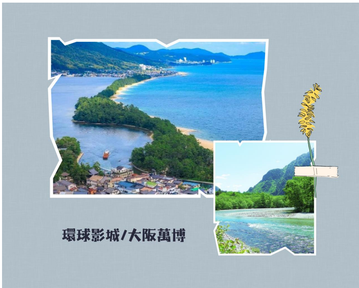
環球影城/大阪萬博