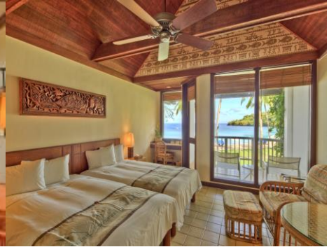
【正面海景房 Deluxe Ocean Front】

【特別提醒】 目前帛琉所有飯店均實施室內&客房樣台禁止吸菸，敬請各位貴賓若要吸菸請至飯店指定之開放式空間 (有擺設菸灰缸的地方)，以免受罰！