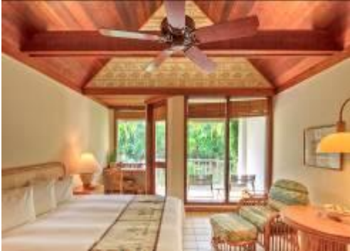
【園景房 Deluxe Garden View】

特別贈送： 住宿三晚以上者，免費提供房間內 Mini Bar 二瓶啤酒、二瓶汽水、二瓶水。