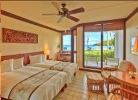
【海景房 Deluxe Ocean View】